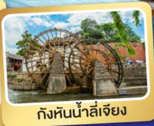
กังหันน้ำลี่เจียง