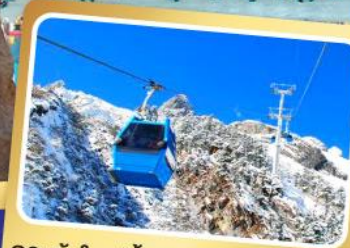
กระเช้าใหญ่ขึ้นภูเขาหิมะมังกรหยก