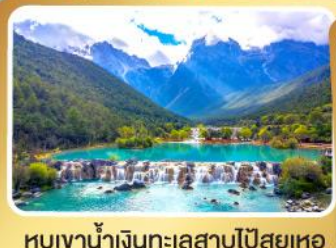
หุบเขาน้ำเงินทะเลสาบไต้สูยเหอ