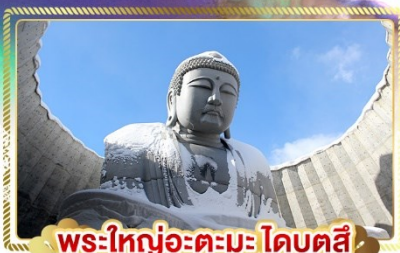
พระใหญ่อะตะมะ-โดบุตสึ