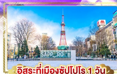
อิสระที่เมืองซัปโปโร 1 วัน