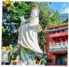
เจ้าแม่กวนอิมริฟลัสเมย์

23 กุมภาพันธ์ 2568 วันยืมเงินเจ้าแม่กวนอิม วัดฮ่องฮำ