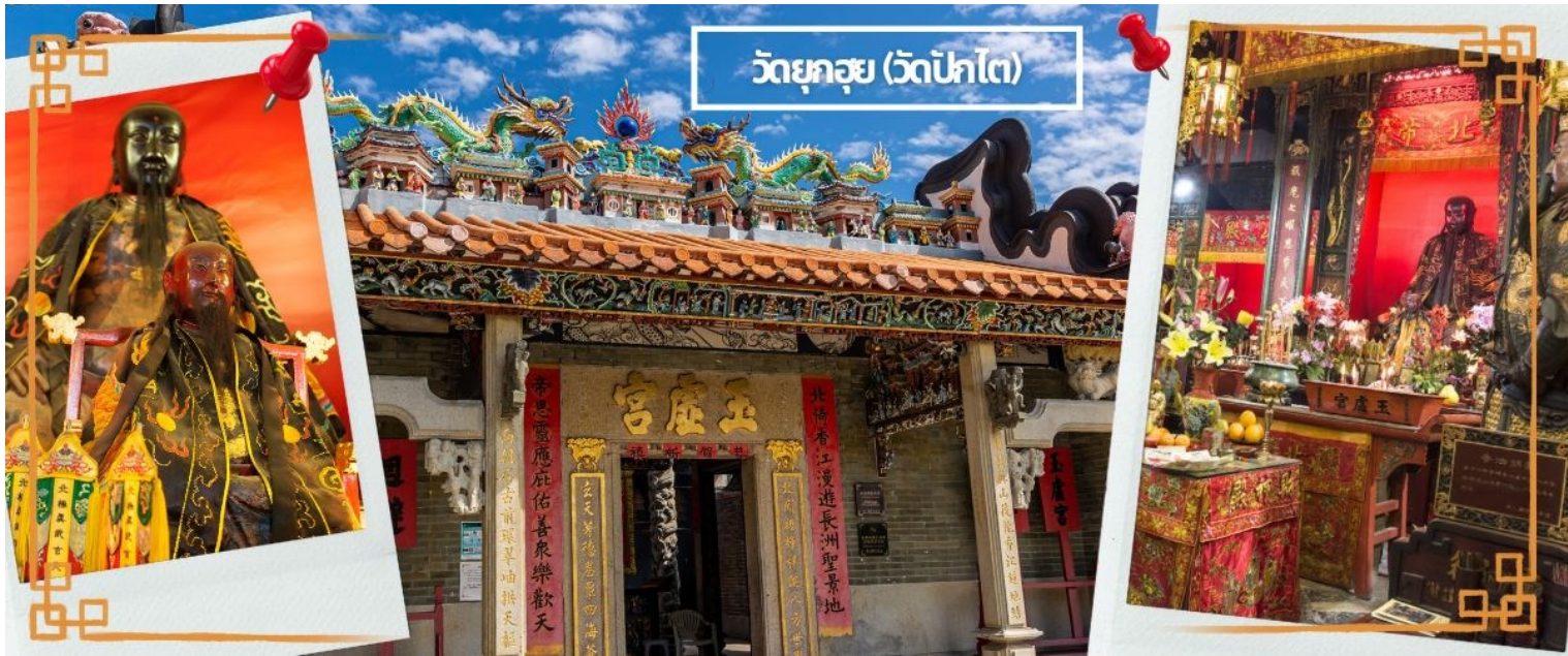
วัดยกวย (วัดปักไต่)

จากนั้นนำท่านเดินทางสู่ วัดปักไต่ เป็นสถานศักดิ์สิทธิ์ที่มีประวัติมายาวนาน 160 ปี ในเขต WAN CHAI เป็นวัดที่บูชาเทพเจ้าแห่งท้องทะเลในลัทธิเต๋า และชาวฮ่องกงเชื่อกันว่าผู้ใดที่เกิดปีชง หากมาทำการแก้ดวงชะตาแก้ชงประจำปีที่วัดนี้ จะทำให้ร้ายกลายเป็นดีได้ และที่วัดยังมี “เทพเจ้าเปลี่ยนใจ” ที่นิยมมาขอพรให้เรื่องที่ไม่ดีกลายเป็นเรื่องดี หรือคนที่เป็นศัตรูของเราเปลี่ยนใจมาเป็นมิตร จึงเป็นที่นิยมอย่างมากของชาวท้องถิ่น