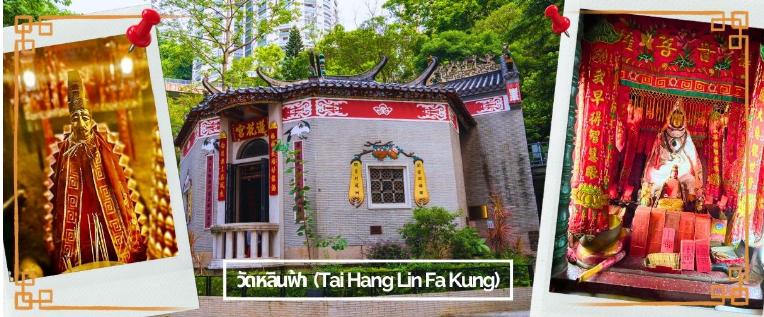
วัดหลินฟู่ (Tai Hang Lin Fa Kung)