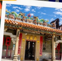
วัดปักไต่