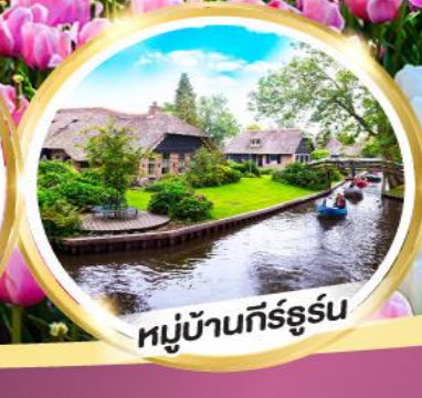
หมู่บ้านกัร์ธูร์น