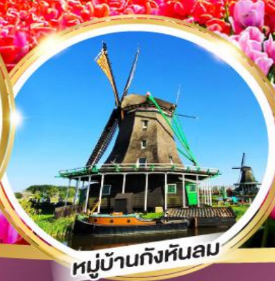
หมู่บ้านกังหันลม