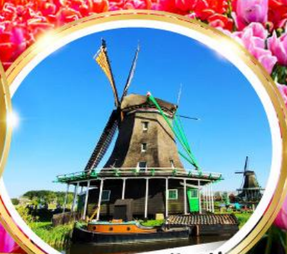
หมู่บ้านกังหันลม