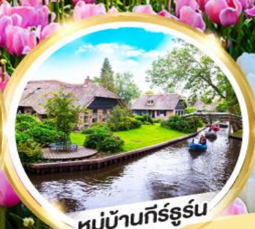
หมู่บ้านกัร์ธูร์น