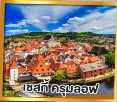
เชสกี คุรมลอฟ