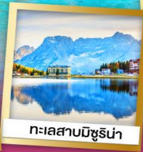
ทะเลสาบมิชูริน่า