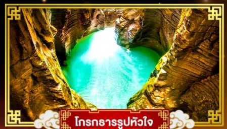
โตรกรารรูปหัวใจ