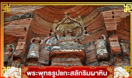
พระพุทธรูปแกะสลักหินผาหิน