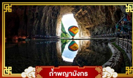
ถ้ำผาผิงกร