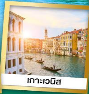
เกาะเวนิส