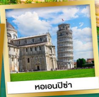
หออนปิซ่า