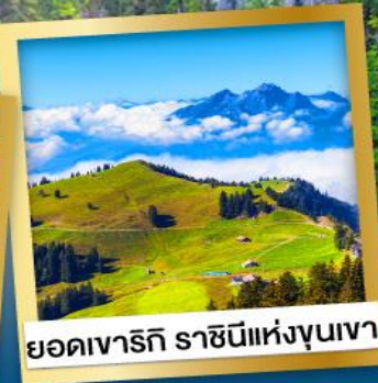
ยอดเขารีกิ ราชนิแห่งขุนเขา