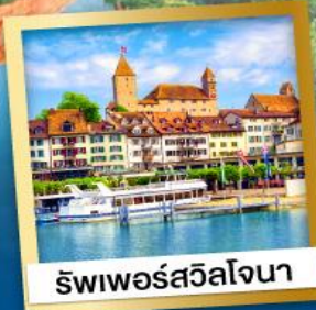
ริพเพอร์สวิลล์