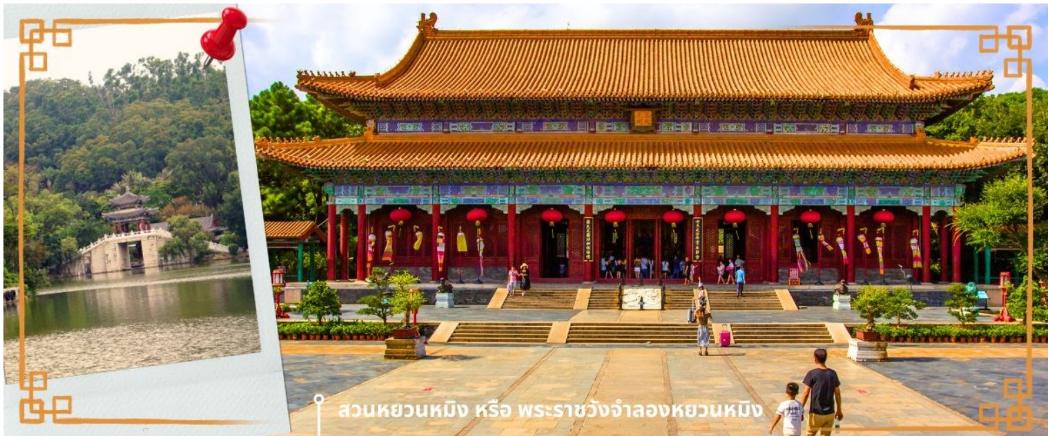
สวนหยวนหมิง หรือ พระราชวังจำลองหยวนหมิง

จากนั้นนำท่านสู่ ร้านหยก หยกในจีนโบราณจนมาถึงสมัยนี้ ยังมีความเชื่อว่าเป็นอัญมณีที่ล้ำค่าและหายาก บ่งบอกฐานะของสตรีในสมัยก่อน แต่ในสมัยนี้ เชื่อกันว่าหยกสีเขียวนั้นเหนียวนำโชคและความร่ำรวย ดังคำกล่าวที่ว่า“สีเขียวเหนียวทรัพย์” ถือเป็น การเสริมดวงจัญที่ดีของผู้สวมใส่อิสระให้ท่านได้เรียนรู้ชนิดของหยกและเลือกซื้อตามใจชอบจากนั้นนำท่านสู่ สวนหยวนหมิง หรือ พระราชวังจำลองหยวนหมิง ตั้งอยู่ ณ ใจกลางหุบเขาซีลิน เมืองฉู่ไห่ สร้างขึ้นเลียนแบบพระราชวังหยวนหมิง ณ กรุงปักกิ่ง สิ่งก่อสร้างต่างๆ มากกว่า 100 ชิ้น มีขนาดเท่าของจริงในอดีตทุกชิ้น อาทิ เสาศิณคู้ สะพานข้ามธารทอง ประตูดำกิง ตำนกเจิ้งต๋ากวางหมิง สะพานเก้าเหลี่ยม สวนแห่งนี้โอบล้อมด้วยขุนเขาที่เขียวชอุ่ม และมีพื้นที่ครอบคลุมทะเลสาบขนาดมหึมา ซึ่งมีขนาดเท่ากับสวนเดิมในกรุงปักกิ่ง และยังมี การเพิ่มเติมและตกแต่งสวนที่เป็นศิลปะแบบตะวันตกผสมกับศิลปะจีน