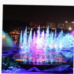
โชว์น้ำสามมิติ OCT BAY WATER SHOW