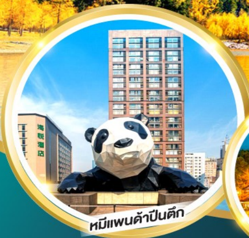
หมี่แพนด้าป็นตัก