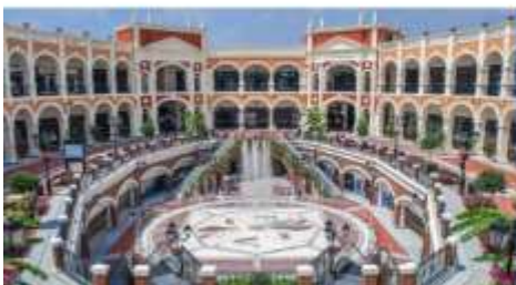
Florentia Village Outlet