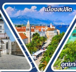
เมืองสปลิต