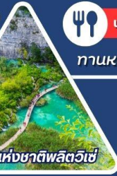
อุทยานแห่งชาติพลิตวิเซ่