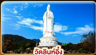
วัดลินห์ฮิ่ง