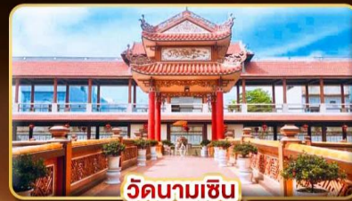
วัดนามเซิน