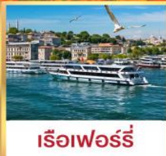
เรือเฟอร์รี่