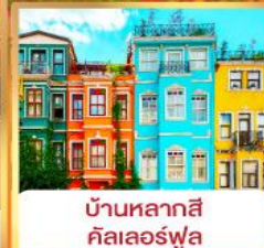
บ้านหลากสี คัลเลอร์ฟูล