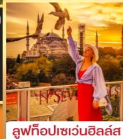
ลูฟทือปเซเวนฮิลล์ส

เที่ยวครบเส้นทางยอดนิยม บินเข้าถึงเย็น เข้าชมสุเหร่ายักษ์คามลิก้า และล่องเรือเฟอร์รี่ ชมเทศกาลทิวลิปแห่งนครอิสตันบูล