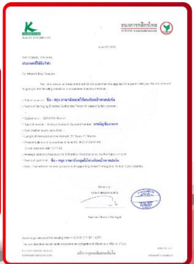
ตัวอย่าง Bank Guarantee ที่ผู้สมัครต้องขอจากธนาคาร