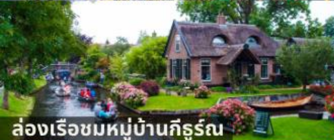
ล่องเรือชมหมู่บ้านกังหันลม

สายการบินการตาร์แอร์เวย์ บินเข้า อัมสเตอร์ดัม บินออก ปารีส น้ำหนักกระเป๋า 25 กก.