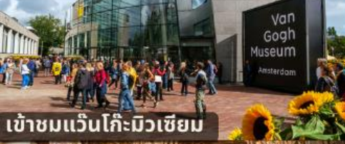
เข้าชมแวนโก๊ะมิวเซียม