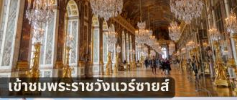
เข้าชมพระราชวังแวร์ซายส์