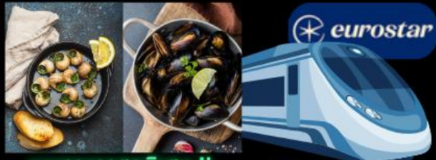
เมนูอาหารสุดพิเศษ !! หอยแมลงภู่อบไวน์ขาว และหอยแอสคาโต้ รถไฟความเร็วสูง จาก เบลเยียม สู่ ฝรั่งเศส