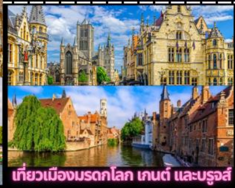
เที่ยวเมืองมรดกโลก เกนต์ และบรูจส์