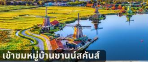
เข้าชมหมู่บ้านชานีส์คันส์