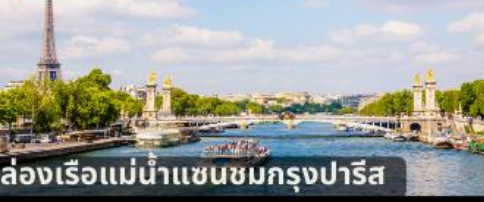
ล่องเรือแม่น้ำแซนชมกรุงปารีส