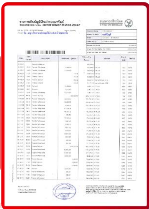
ตัวอย่าง Bank Statement ที่ผู้สมัครต้องขอจากธนาคาร

3.4 ปรับสมุดบัญชีธนาคารตัวจริง และเตรียมไปในวันที่ยื่นวีซ่า