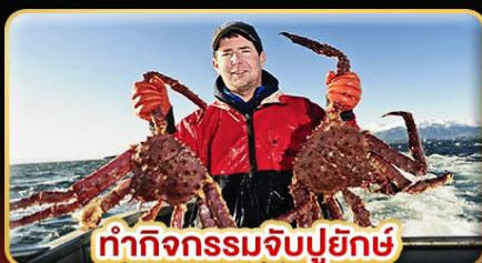
ทำกิจกรรมจับปูยักษ์ “พร้อมเมนูสุดพิเศษ”