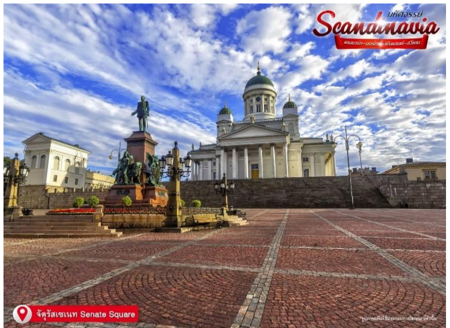
จตุรัสเซเนท Senate Square

คลาสสิกสมัยศตวรรษที่ 19 ด้านหน้าโบสถ์มีรูปปั้นพระเจ้าอเล็กซานเดอร์ที่ 2 ที่บริเวณนั้น หอสมุดแห่งชาติเฮลซิงกิ (Helsinki Central library) หน้าอาคารภายนอกสีเหลือง เสาสีขาวและโถงกลมตรงกลาง ในมุมมองนี้ออกเฉียงใต้ของจตุรัสคือบ้านของเซเดร์โฮล์ม ซึ่งเป็นอาคารหินที่เก่าแก่ที่สุดของเมือง