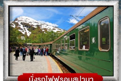
นั่งรถไฟพร้อมสปา

พิเศษ! พักบนเรือสำราญ แบบ Window Room 2 คืน, พักบ้านแซนต้าคลอส