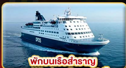
พักบนเรือสำราญ แบบ Window Room 2 คืน