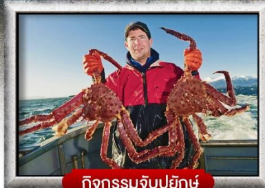
กิจกรรมจับปูยักษ์