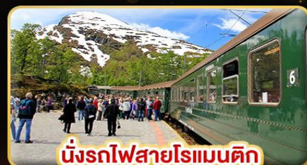
นั่งรถไฟสายโรแมนติก “พร้อมสปาณา”