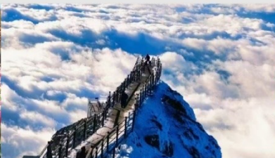
ภูเขาหิมะเจี้ยวจื่อ