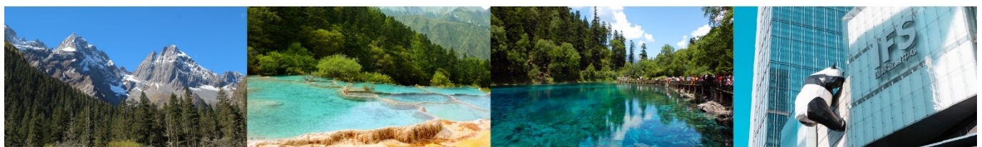
ภูเขาซีดรุณี (หุบเขาซวงเจียวโกว)