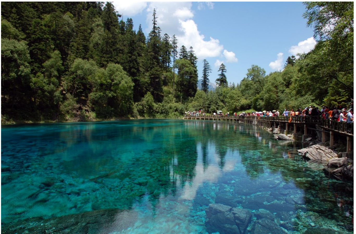
ฤดูใบไม้ผลิ (SPRING)