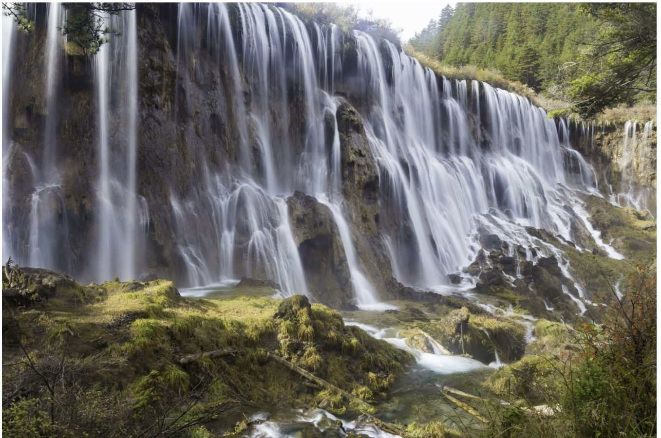
ฤดูใบไม้ผลิ (SPRING)