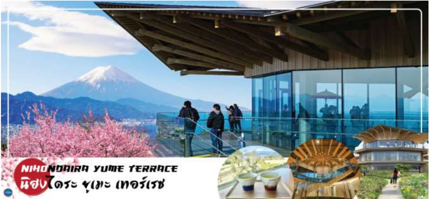
NIHONDAIRA YUME TERRACE นิฮงไดระ ยูเมะ เทอร์เรซ

ระหว่างระเบียบังกับทางเดินไปยังที่จอดรถ นอกจากนี้ยังมีการจัดแสดงนิทรรศการ และคาเฟ่ สำหรับให้ท่านได้เพลิดเพลิน จิบนม ชิมกาแฟ สัมผัสบรรยากาศดี ๆ กับวิวภูเขาไฟฟูจิตามอัธยาศัย