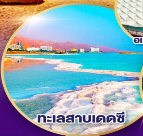
ทะเลสาบเดดซี