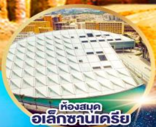
ห้องสมุด อเล็กซานเดรีย

เยือนมหาพีระมิดที่เก่าและนครรัฐเพตรา 2 สิ่งมหัศจรรย์ที่สุดของโลก