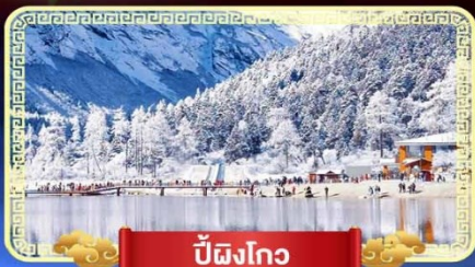
ปี้ผิงโกว

สัมปณีสวรรค์บนดินแห่งเมืองจีน เที่ยวสุดคุ้ม 3 อุทยานทางธรรมชาติ