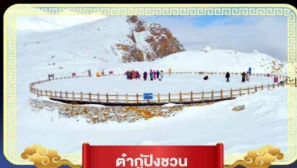
ต้ากู่ปิงชว่น