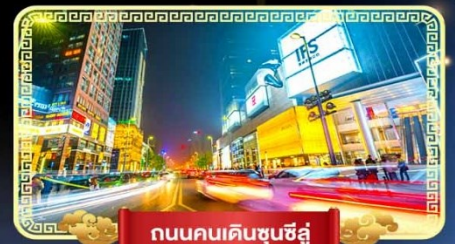
ถนนคนเดินชุนชี่ลู่