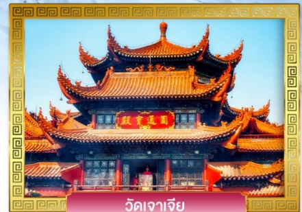
วัดเจาเจีย