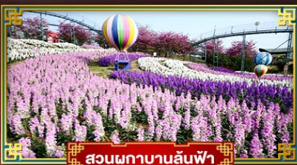
สวนดอกบานล้นฟ้า

อุทยานสวรรค์กุหาหิมะการ์เซียต้ากู่ปิงชว่น