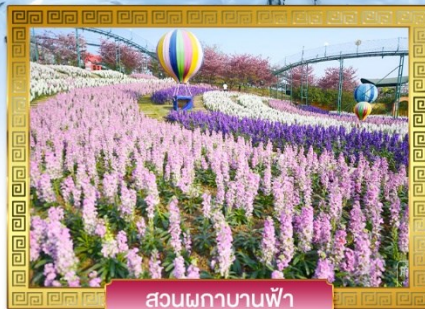
สวนพกาบานฟ้า