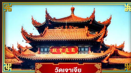
วัดจาเจีย