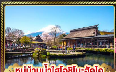
หมู่บ้านน้ำใสโอฮิโนะฮักโค