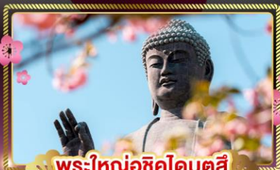
พระใหญ่อุซึคุโดบุตสึ