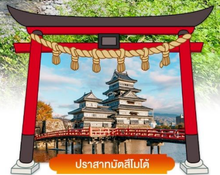
ปราสาทมัตสึโมโด้