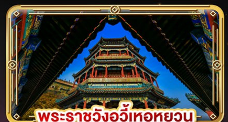
พระราชวังอวิหะทยวน