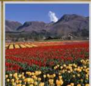
"KUJU HANA PARK"