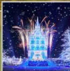
"HUIS TEN BOSCH"