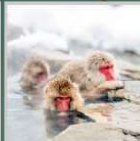
"SNOW MONKEY PARK"