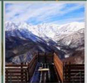
"HAKUBA MOUNTAIN HARBOR"