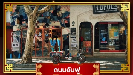
ถนนอันฟู