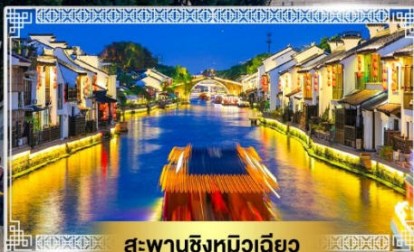
สะพานชิงหมิงเจียว