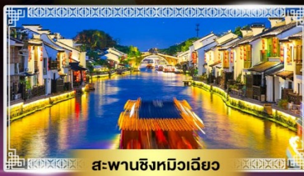
สะพานชิงทิวเฉียว