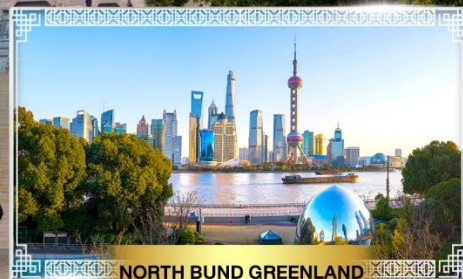
NORTH BUND GREENLAND