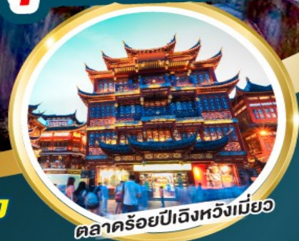
ตลาดร้อยปีฉงชิ่งเหมียว