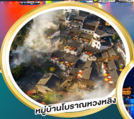
หมู่บ้านโบราณหวงหลิง