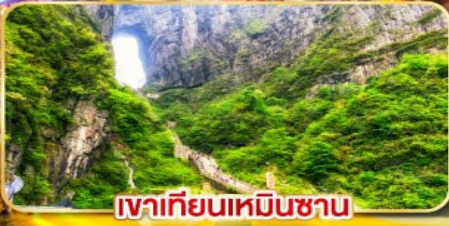
เขาคีเยนเหมินซาน