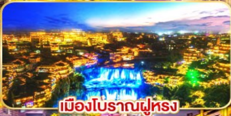
เมืองโบราณฟูหลง

บินตรงจากซา จางเจียเจีย 6 วัน เปิดโลกธรรมชาติ เมืองโบราณสุดคลาสสิก 5 คืน