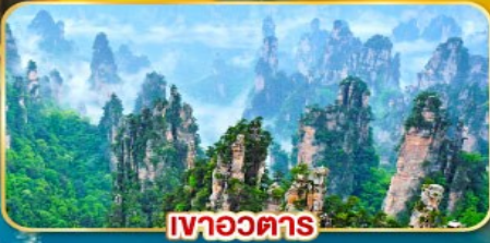
เขาวงตาร