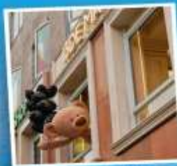
คาเฟ่ 13 DEMARZO