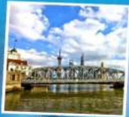
สะพานไข่วังปายตุ้เดียว