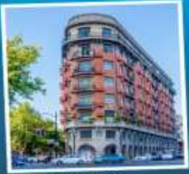
ถนนอู่คัง