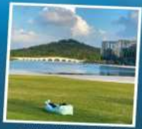
TWIN HILL EXPRO