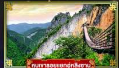
หุบเขารอยแยกอุทลิ่งซาน