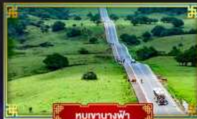
หุบผาทางฟ้า