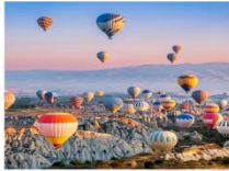
เมืองคัปปาโดเกีย

** พักที่ Under Cave Hotel 5* หรือเทียบเท่า **