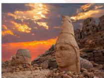
ชมพระอาทิตย์ตกดิน ณ ภูเขาเนมรุต

** พักที่ Euphrat Hotel Nemrut 4* หรือเทียบเท่า **