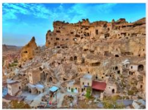
นครใต้ดิน