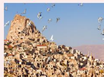
หมู่บ้านของนกพิราบ

** พักที่ Under Cave Hotel 5* หรือเทียบเท่า **