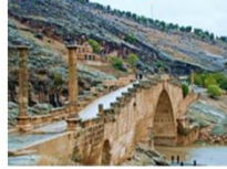
สะพานเซเวอรัน