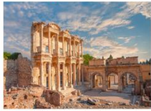
เมืองเอเฟซุส