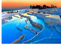
เมืองปามุกคาเล่

** พักที่ Richmond Thermal Hotel 5* หรือเทียบเท่า **