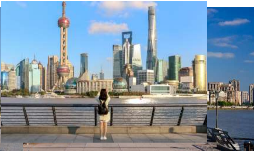
ตะวันออก-ตะวันตก

Highlight! สุดว้าวกับวิวพื้นหลังสุดอลังการกับหอไข่มุกสุดทันสมัย เป็นมุมสุดฮิตที่มาแล้วห้ามพลาดต้องถ่ายอวดลงโซเชียลเรียกยอดไลค์ ❤️