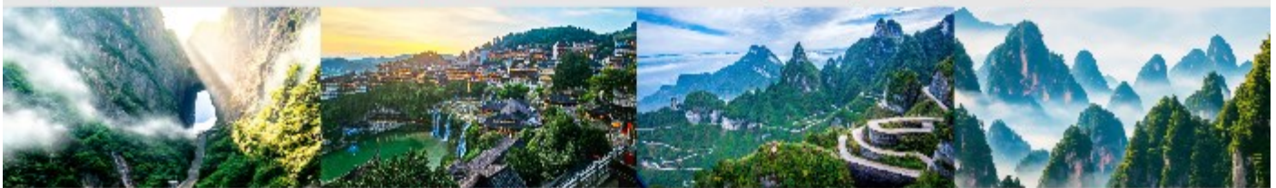
ประตูลั่วสวรงค์