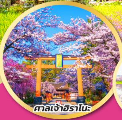
ศาลเจ้าอิราโนะ