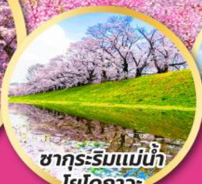
ซากุระริมแม่น้ำ โยโดกาเวะ