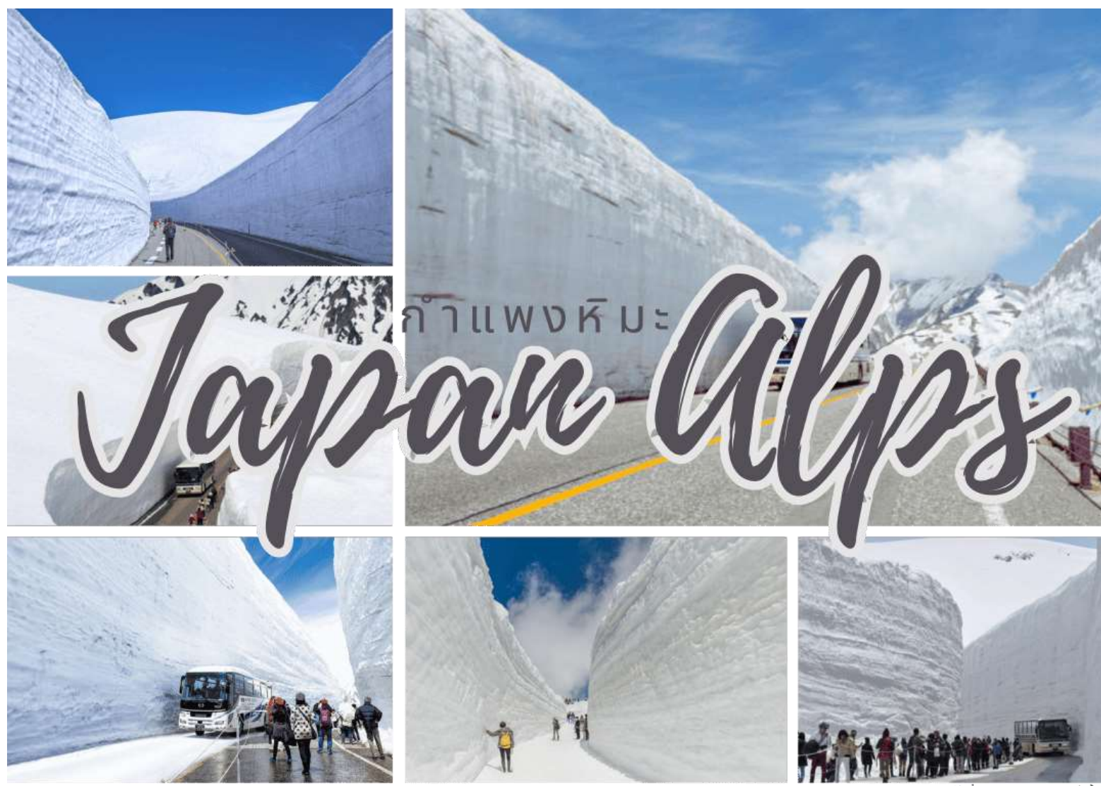
รูปใช้เพื่อประกอบการโฆษณาเท่านั้น

จากนั้นนำท่านชม กำแพงหิมะ (Yuki no Otani) โดยก่อนที่จะมีการเปิดการใช้งานเส้นทางนี้ตามกำหนดการ จะมีการนำเครื่องจักรมาโกหิมะเพื่อเป็นการเคลียร์เส้นทางให้รถบัสวิ่งได้ โดยที่หิมะจำนวนมากจากชั้นตอนนี้ จะถูกนำไปกองไว้บริเวณสองข้างถนนจนเกิดเป็นกำแพงขนาดใหญ่ จุดสูงสุดของกำแพงที่เคยวัดได้อยู่ที่ประมาณ 20 เมตร นับเป็นจุดที่น่าตื่นตาตื่นใจ และสวยงามอย่างแท้จริง อิสระให้ท่านเก็บภาพความสวยงามของกำแพงหิมะที่สวยงามตามอัธยาศัย ได้เวลาอันสมควรนำท่านขึ้นรถบัสทาเทยาม่าโคเจน (Tateyama Kogen Bus) เพื่อเดินทางสู่บิจิโด้ระ (Bijodaira) (ใช้เวลาประมาณ 50 นาที) รถบัสจะวิ่งผ่านกำแพงหิมะเป็นช่วง ๆ จากนั้นนำท่านสู่สถานีทาเทยาม่า (Tateyama Station) โดยเคเบิลคาร์ทาเทยาม่า (Tateyama Cable Car) อีกครั้ง (ใช้เวลาประมาณ 7 นาที)