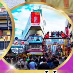
ตลาด อะเมโยโกะ