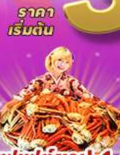
ราคา เริ่มต้น