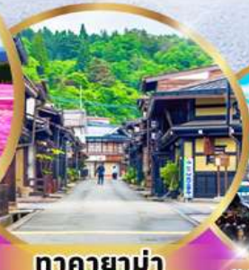
ทาคายาม่า