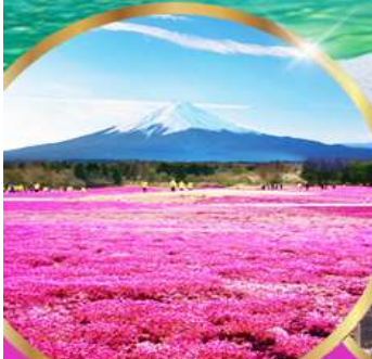
ฟูจิ ชิบะ ซากุระ