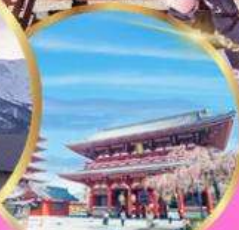
วัดเซ็นโซจิ