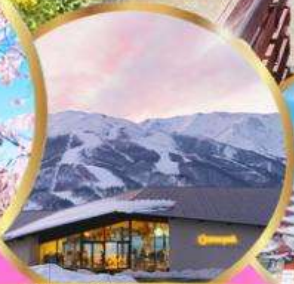
Starbuck snow peak land