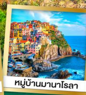
หมู่บ้านมานาโรลา