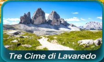
Tre Cime di Lavaredo