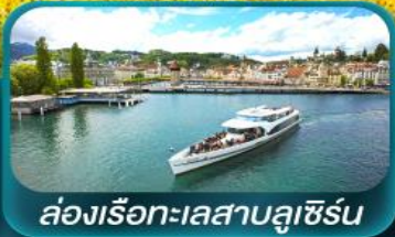
ล่องเรือทะเลสาบลูซิิร์น