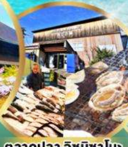
ตลาดปลา อิชิมิซาโนะ