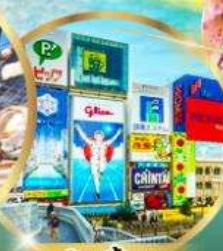
ช้อปปิ้ง ย่านชินโซบาชิ