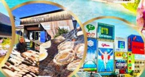
ตลาดปลา อิสุมิซาโนะ