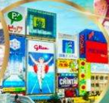
ช้อปปิ้ง ย่านชินโซบาชิ

ราคา เริ่มต้น 28,919 บาท รวมภาษีมูลค่าเพิ่ม 7%