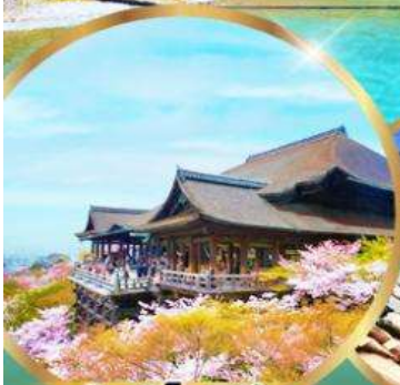
วัดคิโยมิตสึ