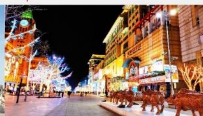
ถนนหวังฝูจิ้ง

*ทางบริษัทฯ ขอสงวนสิทธิ์ในการสลับโปรแกรมทัวร์ตามความเหมาะสมขึ้นอยู่กับสถานการณ์หน้างาน โดยคำนึงถึงผลประโยชน์ของลูกค้าเป็นสำคัญ