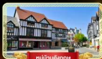
หมู่บ้านอังกฤษ