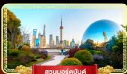
สวนนอร์คัมป์