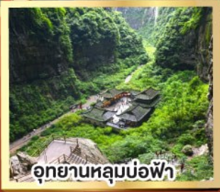
อุทยานหลุมบ่อฟ้า