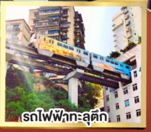
รถไฟฟ้าทะลุตึก