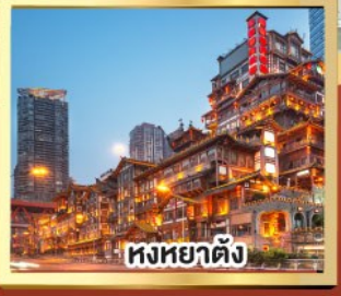
หงหยาดัง