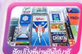
ช้อปบิงที่ย่านชินไซบาชิ

พัก ออนเซ็น ฮามามัตสึ 1 คืน โอซาก้า 1 คืน กิฟู 1 คืน นาโงยะ 1 คืน