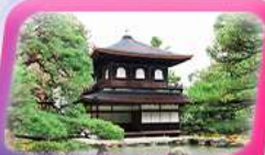
วัดเงินเกียวโต

พัก ออนเซ็น ฮามามัตสึ 1 คืน โอซาก้า 1 คืน กิฟู 1 คืน นาโงยะ 1 คืน